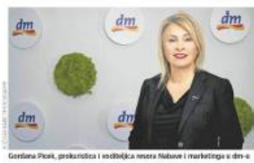
Godišnja Pisci, predstavnica i voditeljica mreže Nalunje i razvojnica u dm-u