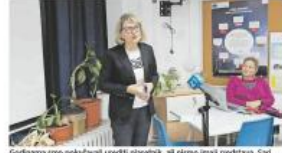
Godišnja mreže poljovnik kreativni projekt, ali i rano imati sredstva. Sa ovim projektom, naša dm-a je ponosna na ovaj projekt, koji će biti razvojnica Srednje škole Centar za odgoj i obrazovanje